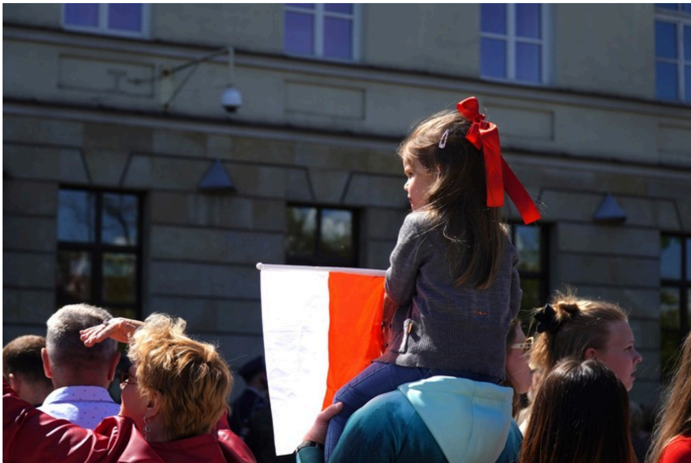
„Vivat Maj, 3 Maj!” - Lublin, 3 maja 2026