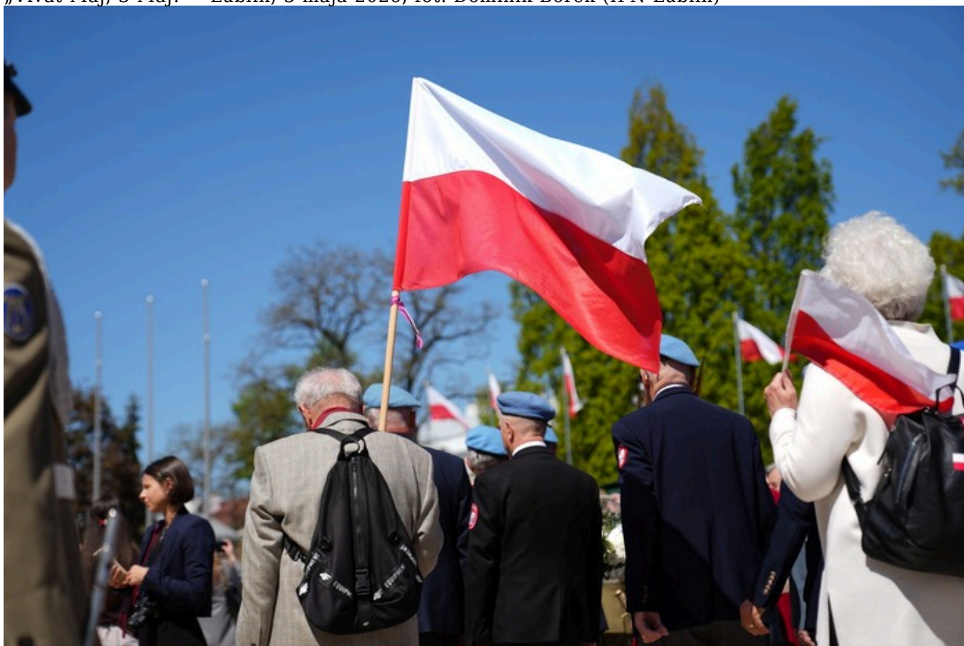
„Vivat Maj, 3 Maj!” - Lublin, 3 maja 2026