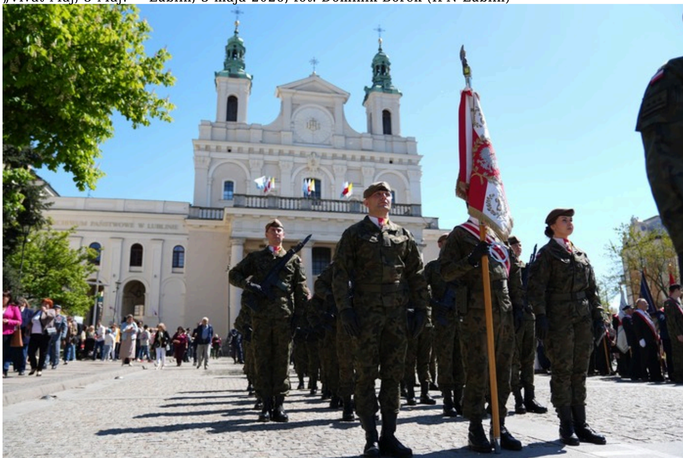
„Vivat Maj, 3 Maj!” - Lublin, 3 maja 2026, fot. Dominik Borek (IPN Lublin)