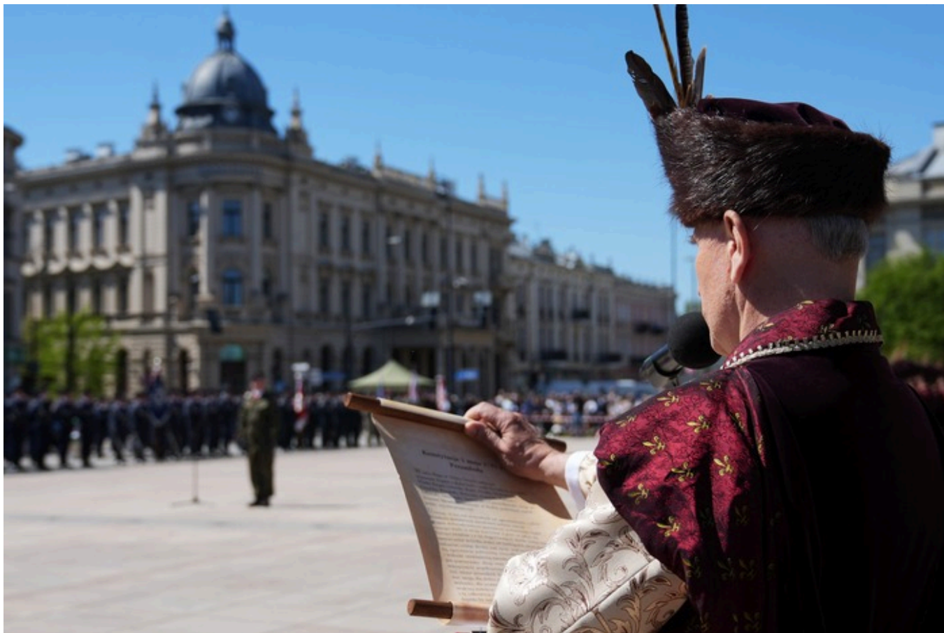
„Vivat Maj, 3 Maj!” - Lublin, 3 maja 2026, fot. Dominik Borek (IPN Lublin)