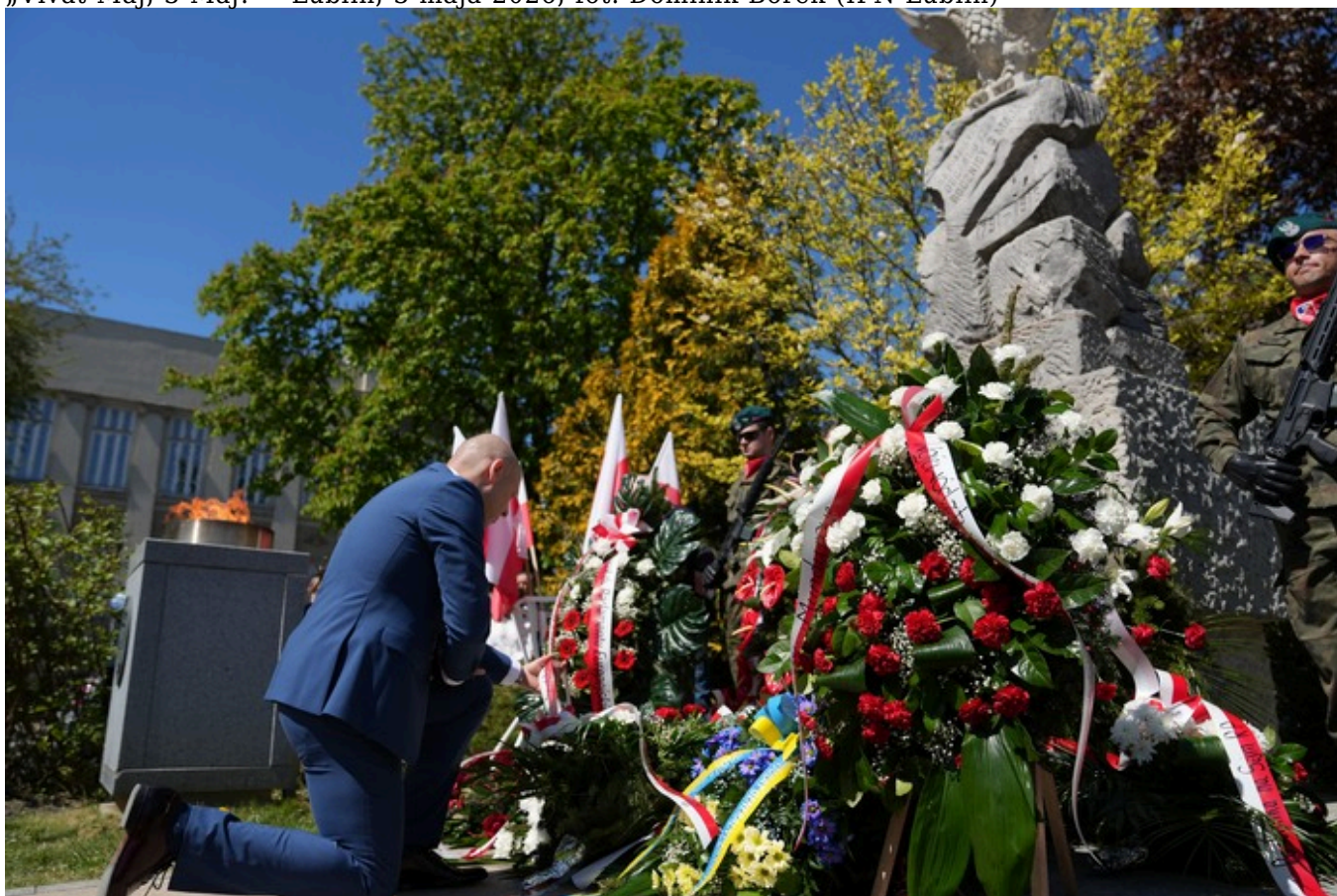
„Vivat Maj, 3 Maj!” - Lublin, 3 maja 2026