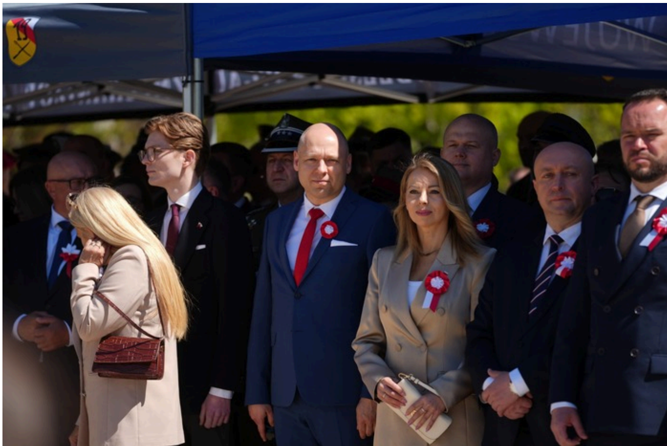
„Vivat Maj, 3 Maj!” - Lublin, 3 maja 2026