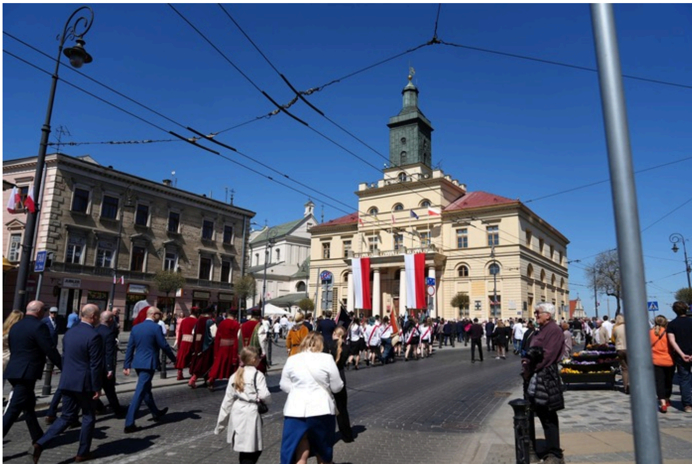
„Vivat Maj, 3 Maj!” - Lublin, 3 maja 2026, fot. Dominik Borek (IPN Lublin)