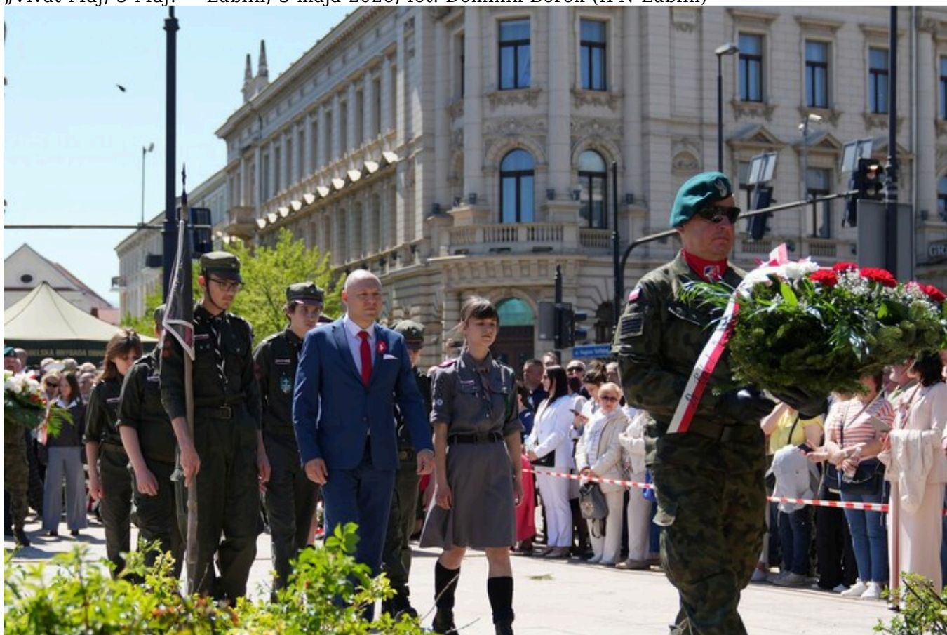
„Vivat Maj, 3 Maj!” - Lublin, 3 maja 2026, fot. Dominik Borek (IPN Lublin)