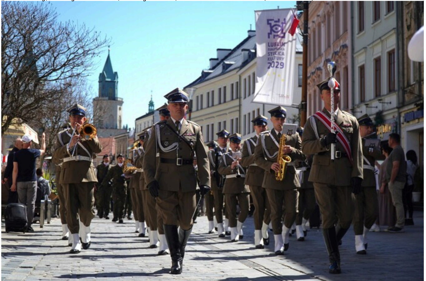
„Vivat Maj, 3 Maj!” - Lublin, 3 maja 2026