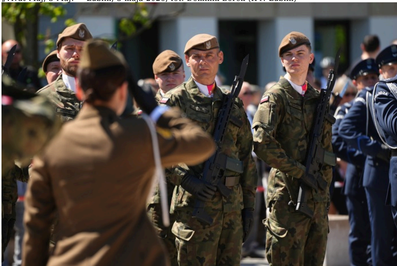
„Vivat Maj, 3 Maj!” - Lublin, 3 maja 2026