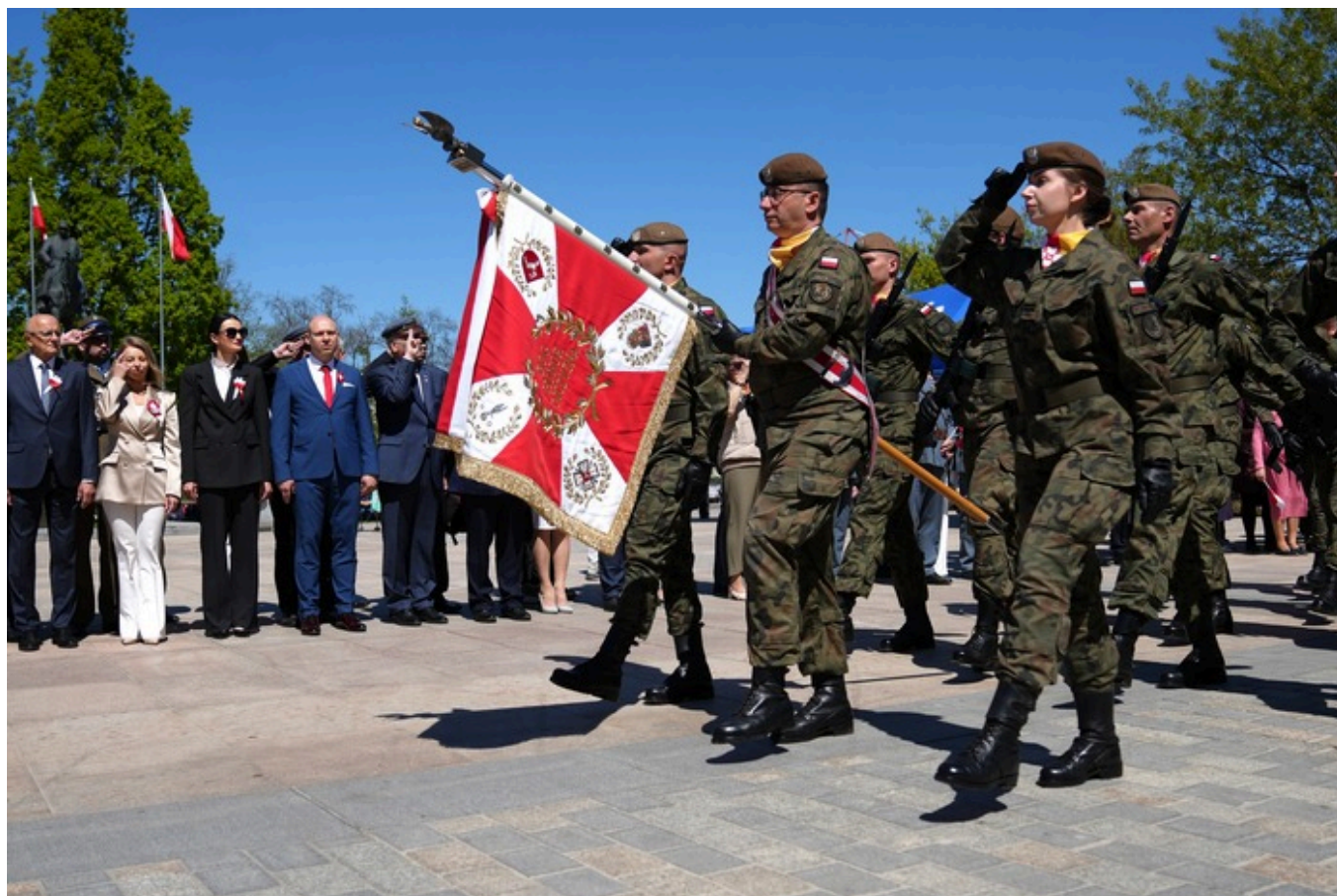
„Vivat Maj, 3 Maj!” - Lublin, 3 maja 2026