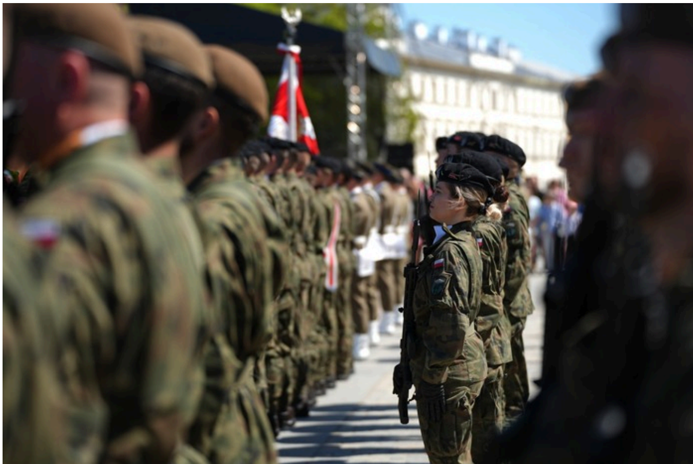
„Vivat Maj, 3 Maj!” - Lublin, 3 maja 2026