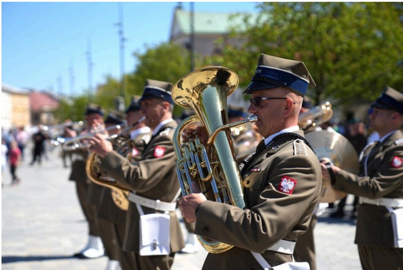
„Vivat Maj, 3 Maj!” - Lublin, 3 maja 2026, fot. Dominik Borek (IPN Lublin)