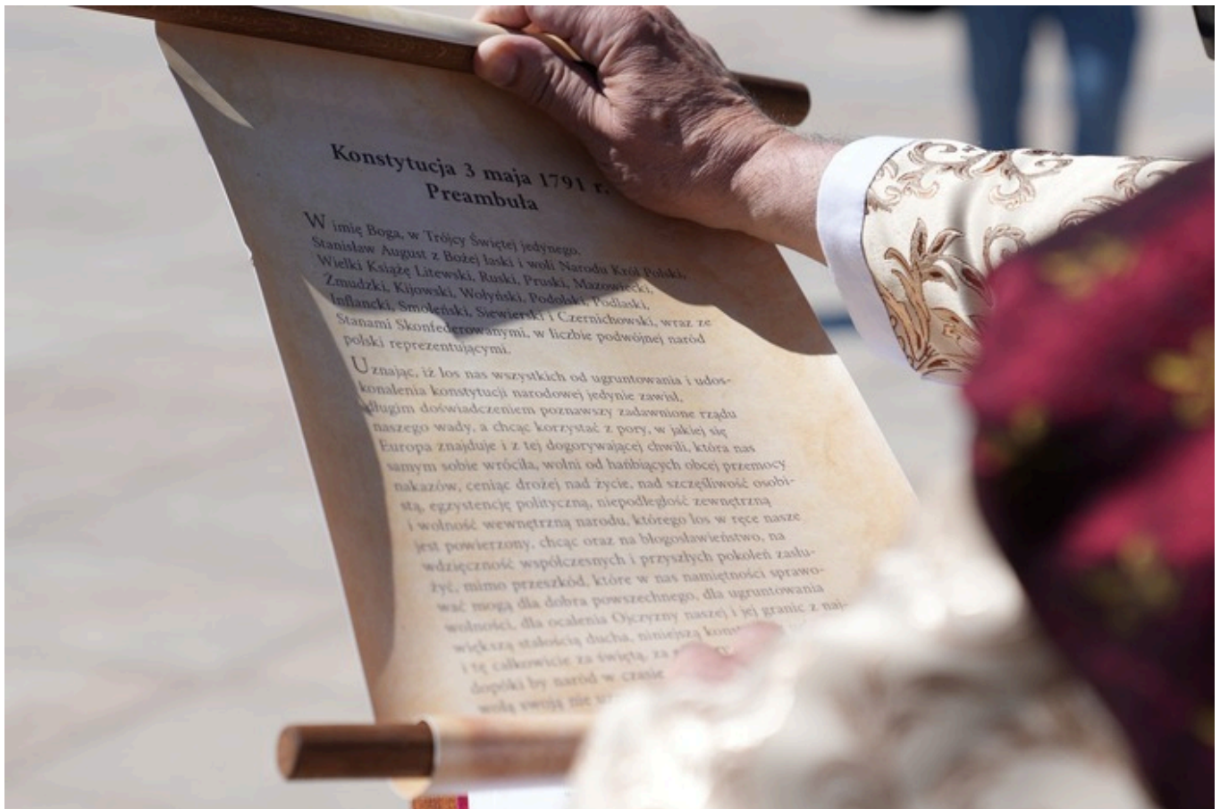
„Vivat Maj, 3 Maj!” - Lublin, 3 maja 2026