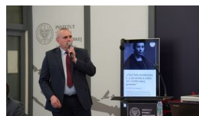
Problemy archiwistyki i edytorstwa źródeł historycznych XX wieku - Lublin, 15 czerwca 2023.