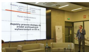
Problemy archiwistyki i edytorstwa źródeł historycznych XX wieku - Lublin, 15 czerwca 2023.