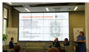
Problemy archiwistyki i edytorstwa źródeł historycznych XX wieku - Lublin, 15 czerwca 2023.