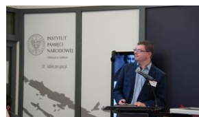
Problemy archiwistyki i edytorstwa źródeł historycznych XX wieku - Lublin, 15 czerwca 2023.