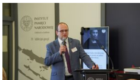
Problemy archiwistyki i edytorstwa źródeł historycznych XX wieku - Lublin, 15 czerwca 2023.