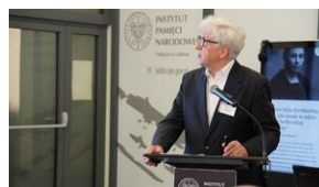
Problemy archiwistyki i edytorstwa źródeł historycznych XX wieku - Lublin, 15 czerwca 2023.