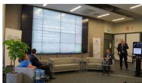
Problemy archiwistyki i edytorstwa źródeł historycznych XX wieku - Lublin, 15 czerwca 2023.