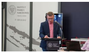
Problemy archiwistyki i edytorstwa źródeł historycznych XX wieku - Lublin, 15 czerwca 2023.

W panelu trzecim prelegenci omówili problemy badawcze i edytorskich na przykładzie wybranych przez siebie źródeł XX-wiecznych.