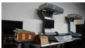
Problemy archiwistyki i edytorstwa źródeł historycznych XX wieku - Lublin, 15 czerwca 2023.