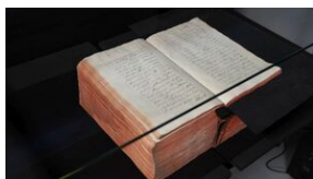
Problemy archiwistyki i edytorstwa źródeł historycznych XX wieku - Lublin, 15 czerwca 2023.