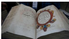
Problemy archiwistyki i edytorstwa źródeł historycznych XX wieku - Lublin, 15 czerwca 2023.

Konferencję zakończyła wizyta w pracowni digitalizacji Archiwum Państwowego w Lublinie, gdzie również uroczyście zakończono konferencję.