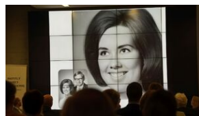
Problemy archiwistyki i edytorstwa źródeł historycznych XX wieku - Lublin, 15 czerwca 2023.