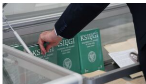
Problemy archiwistyki i edytorstwa źródeł historycznych XX wieku - Lublin, 15 czerwca 2023.

Dodatkowym elementem konferencji była sesja posterowa, gdzie przedstawiono wpływ nowych technologii na jakość i sposób przetwarzania źródeł historycznych. Ponadto w galotach przygotowanych przez Oddziałowe Archiwum w Lublinie oraz Archiwum Państwowe przygotowane zostały przykłady oryginalnych źródeł, znajdujących się w zasobach obu instytucji wraz z ich wydaną edycją. Dodać należy, że tym samym Oddziałowe Archiwum IPN w Lublinie prezentując materiały archiwalne w postaci, m.in. książ więziennych Więzienia na Zamku w Lublinie wpisało się w obchody Międzynarodowego Dnia Archiwów.