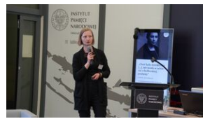
Problemy archiwistyki i edytorstwa źródeł historycznych XX wieku - Lublin, 15 czerwca 2023.