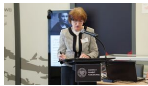
Problemy archiwistyki i edytorstwa źródeł historycznych XX wieku - Lublin, 15 czerwca 2023.