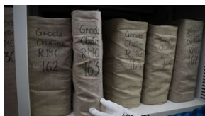
Problemy archiwistyki i edytorstwa źródeł historycznych XX wieku - Lublin, 15 czerwca 2023.