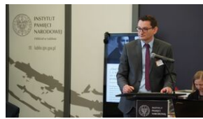
Problemy archiwistyki i edytorstwa źródeł historycznych XX wieku - Lublin, 15 czerwca 2023.