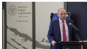
Problemy archiwistyki i edytorstwa źródeł historycznych XX wieku - Lublin, 15 czerwca 2023.

Konferencja rozpoczęła się od sesji plenarnej, na której prelegenci przedstawili, uzupełniając się nawzajem, ogólne zagadnienia dotyczące problemów edytorskich oraz prawnych dostępu do źródeł archiwalnych.