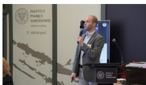
Problemy archiwistyki i edytorstwa źródeł historycznych XX wieku - Lublin, 15 czerwca 2023.