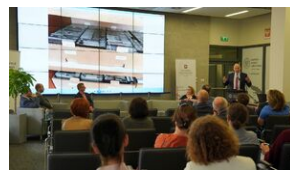
Problemy archiwistyki i edytorstwa źródeł historycznych XX wieku - Lublin, 15 czerwca 2023.