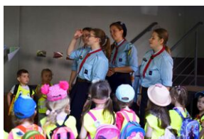
#IPN:ŁODYCH. Fot. Uczestnicy Akcja Akredytacja