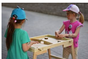
#IPN:ŁODYCH.

Księgarnia IPN zmieniła się w Pokój Zagadek poświęcony historii ratowania słynnych obrazów Jana Matejki w czasie II wojny światowej. Zadaniem uczestników było umieszczenie obrazów w zamkniętej skrzyni, tak aby zgodnie z historią przetransportować je na przedmieścia Lublina i ukryć pod ziemią. Klucz do kłódki można było zdobyć rozwiązując szereg zagadek i łamigłówek. Księgarnia była również biurem prasowym „Akcji Akredytacji”. Młodzież z Państwowego Liceum Sztuk Plastycznych im. C.K. Norwida w Lublinie oraz z XXVII Liceum Ogólnokształcącego im. Zesłańców Sybiru w Lublinie otrzymała akredytacje i fotografowała całe wydarzenie, a ich zdjęcia były regularnie publikowane na profilach społecznościowych IPN.