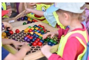
#IPN:ŁODYCH. Fot. Uczestnicy Akcja Akredytacja