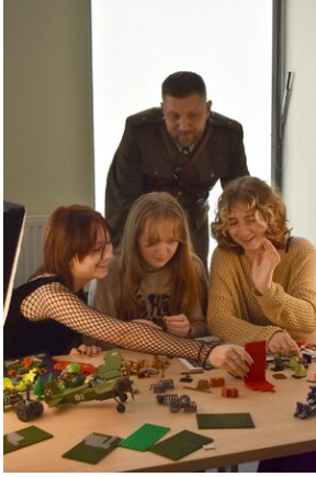
#IPNMŁODYCH.

Kolejną atrakcją projektu była mobilna gra miejska „Na ratunek Matejce”, podczas której uczestnicy starali się uratować słynne obrazy Jana Matejki przed niebezpieczeństwem wojny, przemierzając ulice Lublina i podejmując prawdziwy wyścig z czasem. Zwycięzców nagrodziliśmy publikacjami IPN.