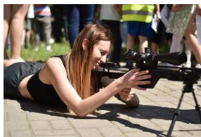
#IPNMŁODYCH. Fot. Uczestnicy Akcja Akredytacja