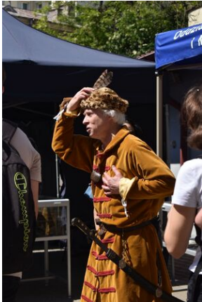
#IPNMŁODYCH. Fot. Uczestnicy Akcja Akredytacja

tradycjach, dziejach oręża polskiego czy też przedmiotach kultu religijnego. Swoje stanowisko zorganizowali rekonstruktorzy ze „Stowarzyszenia Rekonstrukcji Historycznej Wrzesień 39”. Uczestnicy mogli przyrzeć się bliżej wyposażeniu armii polskiej w II RP, zarówno broni jak i systemom łączności. Dużym zainteresowaniem cieszyła się przedwojenna sanitarka i motocykl sokół.