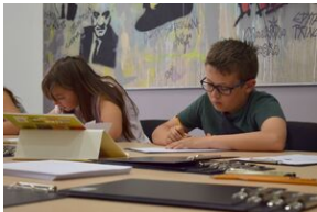
#IPNMŁODYCH.