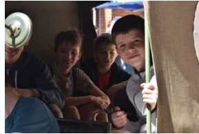
#IPNMŁODYCH. Fot. Uczestnicy Akcja Akredytacja

We wnętrzu Archiwum IPN na uczestników czekało spotkanie z partyzantem z Grupy Rekonstrukcji Historycznej im. 1 Pułku Legii Nadwiślańskiej Ziemi Lubelskiej NSZ, który opowiadał o umundurowaniu i uzbrojeniu podziemia komunistycznego. Czytelnia akt jawnych w czasie IPN Młodych stała się pracownią młodego archwisty, gdzie można było opracować i zeskanować dokumenty, a także przymierzyć strój archiwalny.