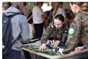
#IPNMŁODYCH. Fot. Uczestnicy Akcja Akredytacja