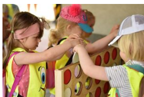
#IPN:ŁODYCH. Fot. Uczestnicy Akcja Akredytacja

Było to również miejsce, w którym młodszy mogli przetestować różne gry podwórkowe z dzieciństwa swoich rodziców i dziadków: klasy, wielkoformatowe bierki, cymbergaj, kółko i krzyżyk. W aktywnościach wspierały nas Przewodniczki - Skauci Europy, organizując gry ruchowe dla dzieci.