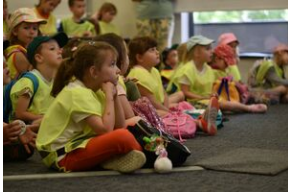
#IPNMŁODYCH. Fot. Uczestnicy Akcja Akredytacja