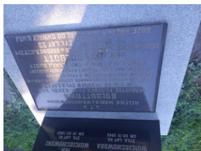
Tablica epitafijna Jana i Heleny Boibott.