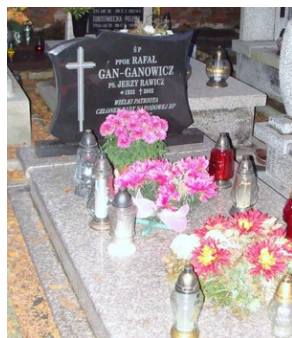
Grób Rafała Gan-Ganowicza na cmentarzu przy parafii św. Agnieszki, ul. Kleberga na Kalinowszczyźnie w Lublinie.

do przechwycenia dokumentów potwierdzających udział sowieckich „doradców” w konflikcie, co miało wymiar międzynarodowy. Okres walk w Afryce i Azji opisał w wielokrotnie wydawanej w drugim obiegu, a potem oficjalnie autobiograficznej książce „Kondotierzy”. Powrócił do Francji, gdzie pracował w różnych zawodach, jednocześnie prowadząc działalność społeczno-polityczną. Po 13 grudnia 1981 r. organizował demonstracje w obronie prześladowanych działaczy „Solidarności”, następnie współpracował z „Solidarnością Walczącą”. Prowadząc audycje na antenie Radia Wolna Europa używał pseudonimu Jerzy Rawicz. W 1989 r. został powołany przez Prezydenta RP na Uchodźstwie Ryszarda Kaczorowskiego na członka Rady Narodowej Rzeczypospolitej Polskiej. W 1997 r. wrócił na stałe do Polski. W Lublinie spędził końcowy okres życia, współpracował z kilkoma organizacjami społecznymi, spotykał się z młodzieżą. Postanowieniem Prezydenta RP Lecha Kaczyńskiego z 15 czerwca 2007 został pośmiertnie odznaczony Krzyżem Oficerskim Orderu Odrodzenia Polski. W tym roku przypada 20 rocznica śmierci ppor. Rafała Gan-Ganowicza. Grób zlokalizowany jest w sektorze 4 rząd 4.