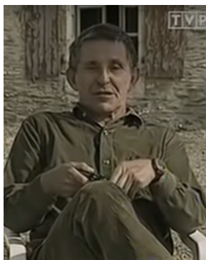
Rafał Gan-Ganowicz.

• Tablica epitafijna poświęcona Marianowi Tadeuszowi Mokrskiemu umieszczona na Grobowcu Rodziny Morskich, na cmentarzu przy ul. Lipowej w Lublinie. Lokalizacja grobowca sektor 6 (dokładniej wzdłuż alei między sektorem 6 a 5A).