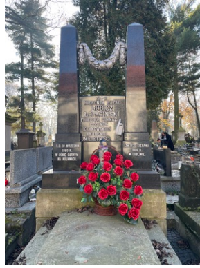
Grób Hieronima Łopacińskiego na cmentarzu przy ul. Lipowej w Lublinie