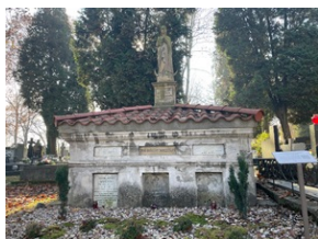
Gróbowiec Rodziny Mokrskich.

Nasz bohater zginął wraz z załogą „Orła” na Morzu Północnym. Jako datę śmierci podaje się dzień, w którym „Orzeł” miał wrócić z patrolu - 8 czerwca 1940 r.