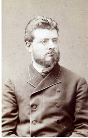
Portret Hieronima Łopacińskiego/Waleriana Twardzicki, domena publiczna, Via Wikimedia Commons