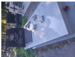
Grobowiec rodziny Wojciechowskich.