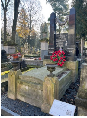
Grób Hieronima Łopacińskiego na cmentarzu przy ul. Lipowej w Lublinie