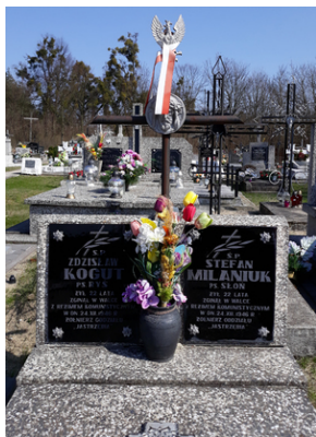
Grób plut. Zdzisława Koguta ps. „Ryś” i Stefana Milaniuka ps. „Słoń” na starym cmentarzu w Woli Wereszczyńskiej (pow. Włodawa).