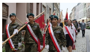
30. rocznica powstania Stowarzyszenia Środowiska Borowicz-an-Sybiraków