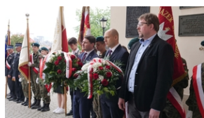
30. rocznica powstania Stowarzyszenia Środowiska Borowicz-an-Sybiraków