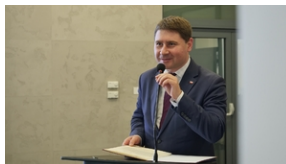
30. rocznica powstania Stowarzyszenia Środowiska Borowiczian-Sybiraków