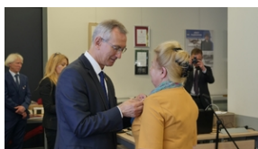
30. rocznica powstania Stowarzyszenia Środowiska