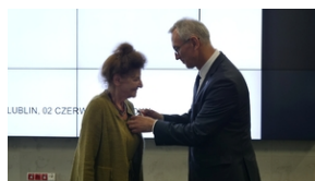
30. rocznica powstania Stowarzyszenia Środowiska