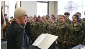
30. rocznica powstania Stowarzyszenia Środowiska Borowiczian-Sybiraków