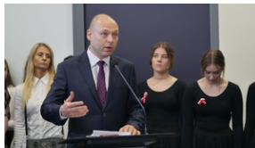
30. rocznica powstania Stowarzyszenia Środowiska Borowiczian-Sybiraków