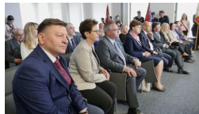
30. rocznica powstania Stowarzyszenia Środowiska Borowiczian-Sybiraków