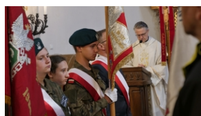
30. rocznica powstania Stowarzyszenia Środowiska Borowicz-an-Sybiraków