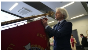
30. rocznica powstania Stowarzyszenia Środowiska Borowiczian-Sybiraków