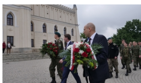
30. rocznica powstania Stowarzyszenia Środowiska Borowicz-an-Sybiraków