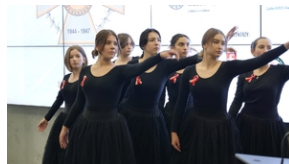
30. rocznica powstania Stowarzyszenia Środowiska Borowiczian-Sybiraków