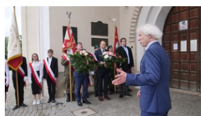
30. rocznica powstania Stowarzyszenia Środowiska Borowicz-an-Sybiraków