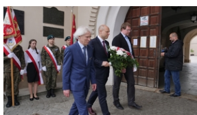
30. rocznica powstania Stowarzyszenia Środowiska Borowicz-an-Sybiraków