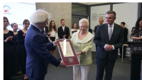
30. rocznica powstania Stowarzyszenia Środowiska Borowiczian-Sybiraków