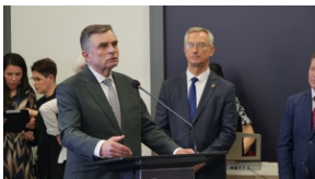
30. rocznica powstania Stowarzyszenia Środowiska Borowiczian-Sybiraków