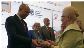
30. rocznica powstania Stowarzyszenia Środowiska Borowiczian-Sybiraków