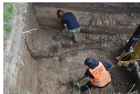
Prace poszukiwawcze na Górkach Czechowskich - Lublin, 16-20 maja 2022.