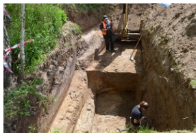
Prace poszukiwawcze na Górkach Czechowskich - Lublin, 16-20 maja 2022.