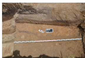
Prace poszukiwawcze na Górkach Czechowskich - Lublin, 16-20 maja 2022.