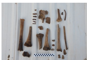
Prace poszukiwawcze na Górkach Czechowskich - Lublin, 16-20 maja 2022.