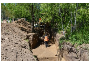
Prace poszukiwawcze na Górkach Czechowskich - Lublin, 16-20 maja 2022.