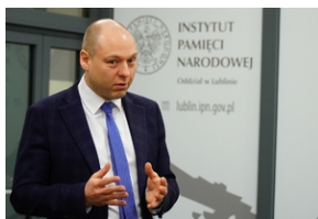
Półfinał VIII edycji ogólnopolskiego konkursu recytatorskiego "W kręgu poezji i prozy lagrowej więźniarek KL Ravensbrück" - Lublin 17 marca 2022.