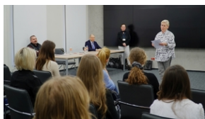
Półfinał VIII edycji ogólnopolskiego konkursu recytatorskiego "W kręgu poezji i prozy lagrowej więźniarek KL Ravensbrück" - Lublin 17 marca 2022. Fot. Szczepan Barczyk IPN Lublin