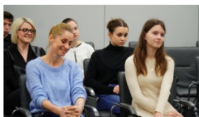
Półfinał VIII edycji ogólnopolskiego konkursu recytatorskiego "W kręgu poezji i prozy lagrowej więźniarek KL Ravensbrück" - Lublin 17 marca 2022.

17 marca 2022 r. w Oddziale IPN Lublin odbył się półfinał VIII edycji ogólnopolskiego konkursu recytatorskiego "W kręgu poezji i prozy lagrowej więźniarek KL Ravensbrück".