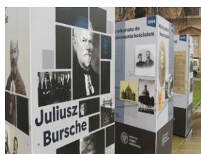
Otwarcie wystawy Juliusz Bursche - Lublin, 21 lutego 2022.

Wystawa została przygotowana przez Oddziałowe Biuro Edukacji Narodowej w Lublinie i przedstawia niezwykłą postać biskupa Juliusza Burschego, zwierzchnika Kościoła ewangelicko-augsburskiego w Polsce.