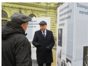
Otwarcie wystawy Juliusz Bursche - Lublin, 21 lutego 2022.

Wystawa składa się z 15 plansz umieszczonych na 5 ekspozytorach i będzie ją można oglądać do 10 marca 2022 r.