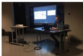
Sesja naukowa „80. Rocznica przemianowania Związku Walki Zbrojnej