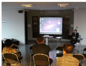
Sesja naukowa „80. Rocznica przemianowania