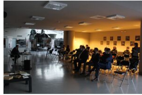
Sesja naukowa „80. Rocznica przemianowania Związku Walki Zbrojnej na Armię Krajową” – Zamość, 14 lutego 2022.

Dziękujemy wszystkim prelegentom i słuchaczom za udział w spotkaniu, zaś Muzeum Fortyfikacji i Broni Arsenal za współudział w organizacji wydarzenia.