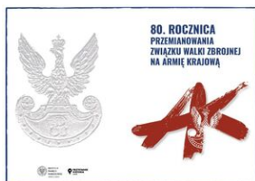
Sesja naukowa „80. Rocznica przemianowania Związku Walki Zbrojnej na Armię Krajową” - Zamość, 14 lutego 2022

14 lutego 2022 r. w ramach obchodów 80. rocznicy przemianowania Związku Walki Zbrojnej na Armię Krajową w Muzeum Fortyfikacji i Broni Arsenał w Zamościu/ Przystanek Historia IPN Zamość odbyła się sesja poświęcona temu wydarzeniu.