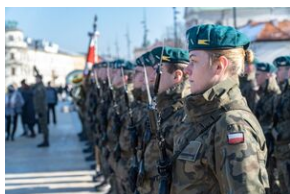
80. rocznica przemianowania ZWZ na AK - Lublin, 14 lutego 2022

Po przemówieniach przyszedł czas na apel pamięci i złożenie kwiatów na płycie Pomnika Nieznanego Żołnierza. Na końcu uczestnicy uroczystości ułożyli ze zniczy również Polski Walczącej ze zniczy.