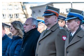
80. rocznica przemianowania ZWZ na AK - Lublin, 14 lutego 2022