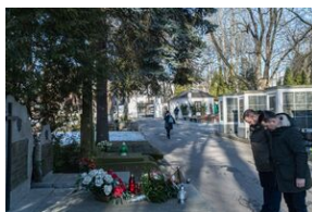
80. rocznica przemianowania ZWZ na AK - Lublin, 14 lutego 2022