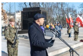
80. rocznica przemianowania ZWZ na AK - Lublin, 14 lutego 2022