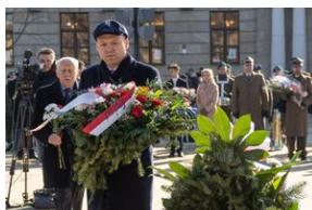
80. rocznica przemianowania ZWZ na AK - Lublin, 14