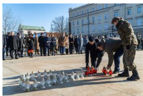
80. rocznica przemianowania ZWZ na AK - Lublin, 14 lutego 2022