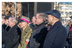
80. rocznica przemianowania ZWZ na AK - Lublin, 14 lutego 2022