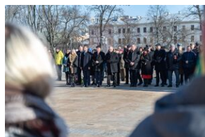
80. rocznica przemianowania ZWZ na AK - Lublin, 14 lutego 2022