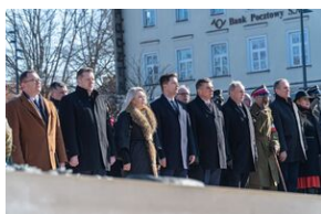
80. rocznica przemianowania ZWZ na AK - Lublin, 14 lutego 2022