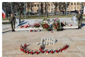
80. rocznica przemianowania ZWZ na AK - Lublin, 14 lutego 2022