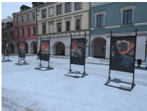
Uroczystości upamiętniające Powstanie Zamojskie - Zamość, 1 lutego 2022.