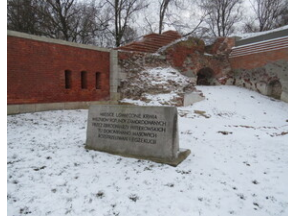
Uroczystości upamiętniające Powstanie Zamojskie - Zamość, 1 lutego 2022.