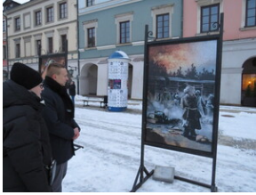
Uroczystości upamiętniające Powstanie Zamojskie - Zamość, 1 lutego 2022.