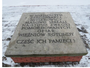
Uroczystości upamiętniające Powstanie Zamojskie - Zamość, 1 lutego 2022.