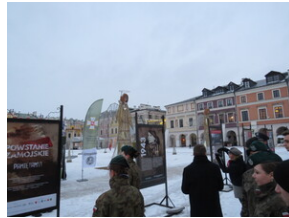
Uroczystości upamiętniające Powstanie Zamojskie - Zamość, 1 lutego 2022.