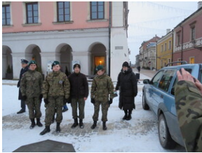
Uroczystości upamiętniające Powstanie Zamojskie - Zamość, 1 lutego 2022.