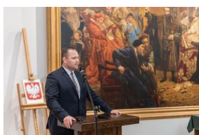
Uroczystość wręczenia Krzyży Wolności i Solidarności – Lublin, 14 grudnia 2021.