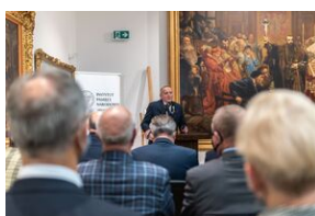
Uroczystość wręczenia Krzyży Wolności i Solidarności – Lublin, 14 grudnia 2021.

Prezes IPN zwrócił również uwagę na to, że woła walki o wolność bohaterów uroczystości pokonała totalitarny reżim komunistyczny