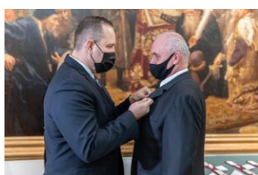
Uroczystość wręczenia Krzyży Wolności i Solidarności – Lublin, 14 grudnia 2021.