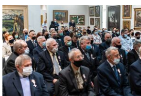
Uroczystość wręczenia Krzyży Wolności i Solidarności – Lublin, 14 grudnia 2021.