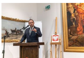
Uroczystość wręczenia Krzyży Wolności i Solidarności – Lublin, 14 grudnia 2021.