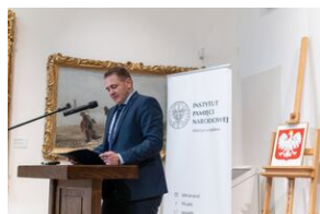
Uroczystość wręczenia Krzyży Wolności i Solidarności - Lublin, 14 grudnia 2021.

Uroczystość wręczenia odznaczeń państwowych działaczom opozycji niepodległościowej z lat 1956–1989 odbyła się w Muzeum Narodowym w Lublinie (Zamek Lubelski) w Galerii Malarstwa Polskiego XIX-XX wieku 14 grudnia 2021, Wzięli w niej udział przedstawiciele władz państwowych, samorządowych, wojska i służb mundurowych oraz stowarzyszeń represjonowanych.