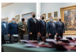
Uroczystość wręczenia Krzyży Wolności i Solidarności – Lublin, 14 grudnia 2021.