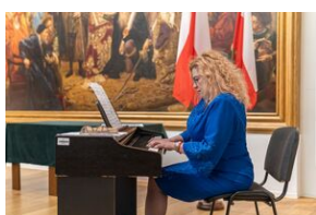
Uroczystość wręczenia Krzyży Wolności i Solidarności – Lublin, 14 grudnia 2021.

– To państwo jesteście tym pokoleniem Polaków, których bieg w sztafecie pokoleń Polaków kończy się niepodległością. (...) W waszych biogramach i życiorysach widzimy ogromne pragnienie wolności, którą spotykało się z równą wobec was wszystkich nienawiścią systemu komunistycznego. Systemu, który was inwigilował, skazywał, internował i więził w komunistycznych więzieniach. Z waszego pragnienia narodziło się zwycięstwo, wolność, i wolna niepodległa Polska – zakończył szef IPN, dr Nawrocki.