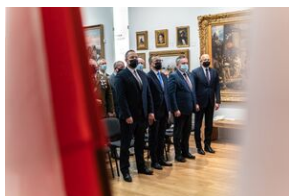
Uroczystość wręczenia Krzyży Wolności i Solidarności - Lublin, 14 grudnia 2021.