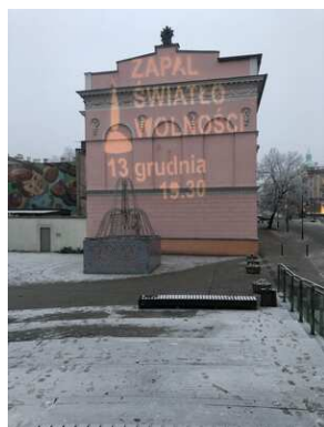
GrafiKa "Zapal światło wolności" w Radomiu.