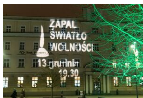
GrafiKa "Zapal światło wolności" na budynku Poczty Polskiej przy Placu Litewskim w Lublinie.