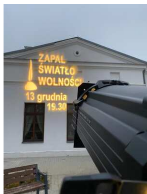
GrafiKa "Zapal światło wolności" w Rykach.