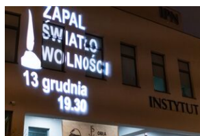
GrafiKa "Zapal światło wolności" na budynku IPN Lublin.

Staraniem lubelskiego IPN w Lublinie (budynek Poczty Polskiej przy Placu Litewskim i siedziba IPN Lublin), Radomiu, Chełmie, Świdniku i Rykach 13 grudnia w godzinach wieczornych zostanie wyświetlona grafika zachęcająca do wzięcia udziału w akcji.