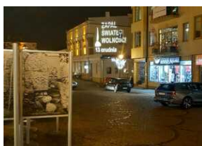
GrafiKa "Zapal światło wolności" w Chełmie.