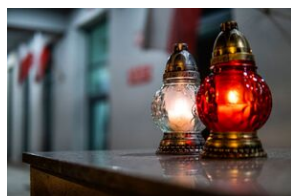
Światło wolności na budynku IPN Lublin.