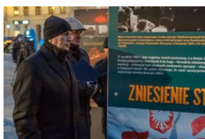
40. rocznica stanu wojennego. Uroczystości upamiętniające - Lublin, 13 grudnia 2021.