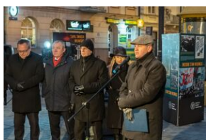
40. rocznica stanu wojennego. Uroczystości upamiętniające - Lublin, 13 grudnia 2021.