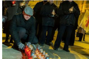
40. rocznica stanu wojennego. Uroczystości upamiętniające – Lublin, 13 grudnia 2021.