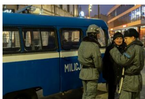
40. rocznica stanu wojennego. Uroczystości upamiętniające - Lublin, 13 grudnia 2021.