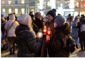
40. rocznica stanu wojennego. Uroczystości upamiętniające – Lublin, 13 grudnia 2021.