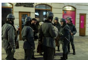
40. rocznica stanu wojennego. Uroczystości upamiętniające - Lublin, 13 grudnia 2021.