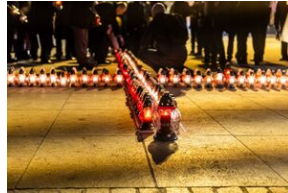
40. rocznica stanu wojennego. Uroczystości upamiętniające – Lublin, 13 grudnia 2021.