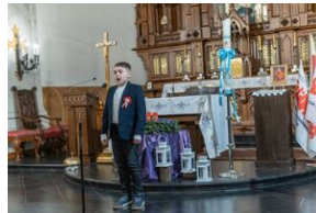
40. rocznica stanu wojennego. Uroczystości upamiętniające – Lublin, 13 grudnia 2021.