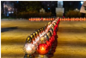
40. rocznica stanu wojennego. Uroczystości upamiętniające – Lublin, 13 grudnia 2021.