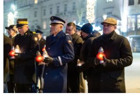
40. rocznica stanu wojennego. Uroczystości upamiętniające – Lublin, 13 grudnia 2021.