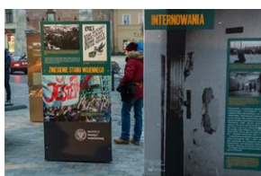
40. rocznica stanu wojennego. Uroczystości upamiętniające - Lublin, 13 grudnia 2021.

Podczas obchodów uczestnicy zobaczyli wystawę elementarną IPN „Stan wojenny 1981-1983”. Ułożyli krzyż z biało-czerwonych zniczy na Placu Litewskim w Lublinie. Wysłuchali Koncertu Pieśni Niepokornej w Kościele Pobrygidzkowskim oraz modlili się w świątyni za ofiary stanu wojennego. Na końcu nastąpił przemarsz pod Światło Pamięci Ofiar Komunistów i pomnik bł. ks. Jerzego Popiełuszki, gdzie zostały złożone kwiaty.