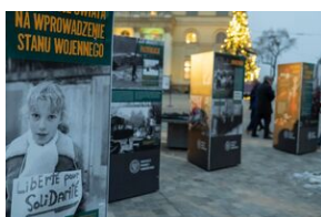
40. rocznica stanu wojennego. Uroczystości upamiętniające - Lublin, 13 grudnia 2021.