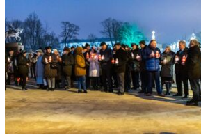
40. rocznica stanu wojennego. Uroczystości upamiętniające – Lublin, 13 grudnia 2021.