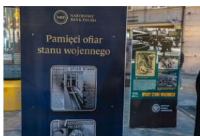
40. rocznica stanu wojennego. Uroczystości upamiętniające - Lublin, 13 grudnia 2021.