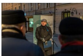
40. rocznica stanu wojennego. Uroczystości upamiętniające - Lublin, 13 grudnia 2021.