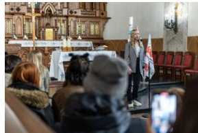
40. rocznica stanu wojennego. Uroczystości upamiętniające – Lublin, 13 grudnia 2021.