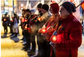
40. rocznica stanu wojennego. Uroczystości upamiętniające – Lublin, 13 grudnia 2021.