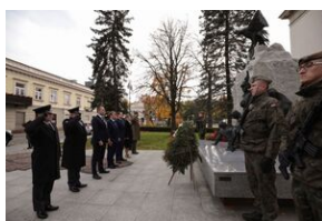
Składanie kwiatów pod pomnikiem Armii Krajowej w Radomiu.