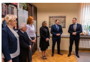
Spotkanie prezesa IPN dr. Karola Nawrockiego z pracownikami Delegatury IPN Radom.