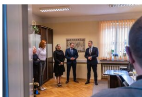
Spotkanie prezesa IPN dr. Karola Nawrockiego z pracownikami Delegatury IPN Radom.