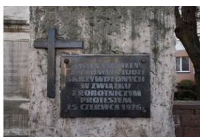
Pomnik upamiętniający strajk w Radomiu w czerwcu 1976 r.