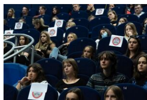
Młodzież na spotkaniu edukacyjnym dot. Teresy Grodzińskiej i kpt. Józefa Marjańskiego w