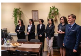
Spotkanie prezesa IPN dr. Karola Nawrockiego z pracownikami Delegatury IPN Radom.

Prezes IPN dr Karol Nawrocki spotkał się również z pracownikami Delegatury IPN w Radomiu.