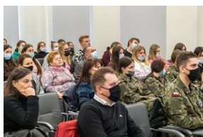
Uczestnicy konferencji edukacyjnej o stratach polskich dóbr kultury w czasie II wojny światowej „Dzieła utracone. Przywracanie pamięci”