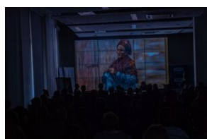
Projekcja wideo Fundacji Dziedzictwa Kultury Polskiej w Warszawie o dziełach utraconych i odzyskiwaniu ich przez Fundację.