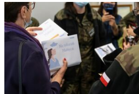
Młodzież z XXVII LO w Lublinie z pakietami mobilnej gry terenowej „Na ratunek Matejce”.

Wydarzenie zakończone zostało wernisażem prac utraconych wykonanych przy zastosowaniu tej samej techniki co oryginały. O obrazach opowiadał Marek Skorupski.