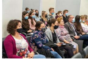
Uczestnicy konferencji edukacyjnej o stratach polskich dóbr kultury w czasie II wojny światowej „Dzieła utracone. Przywracanie pamięci”