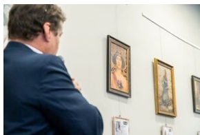
Wernisaż prac utraconych wykonanych przy zastosowaniu tej samej techniki co oryginały.