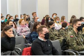
Uczestnicy konferencji edukacyjnej o stratach polskich dóbr kultury w czasie II wojny światowej „Dzieła utracone. Przywracanie pamięci”