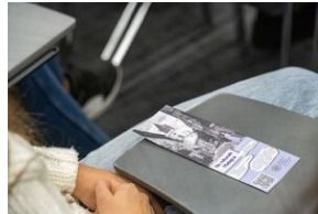
Zakładka promująca mobilną grę „Na ratunek Matejce”.