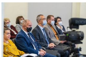
Uczestnicy konferencji edukacyjnej o stratach polskich dóbr kultury w czasie II wojny światowej „Dzieła utracone. Przywracanie pamięci”

wkładzie artystów w odtwarzanie utraconych dzieł sztuki.