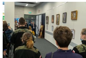
Wernisaż prac utraconych wykonanych przy zastosowaniu tej samej techniki co oryginały.