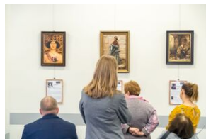
Wernisaż prac utraconych wykonanych przy zastosowaniu tej samej techniki co oryginały.