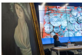
Konferencja edukacyjna o stratach polskich dóbr kultury w czasie II wojny światowej „Dzieła utracone. Przywracanie pamięci”.