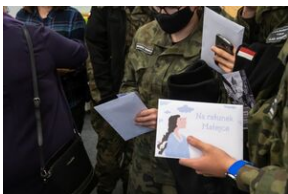
Młodzież z XXVII LO w Lublinie z pakietami mobilnej gry terenowej „Na ratunek Matejce”.

Wydarzenie zakończone zostało wernisażem prac utraconych wykonanych przy zastosowaniu tej samej techniki co oryginały. O obrazach opowiadał Marek Skorupski.