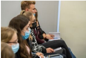
Uczestnicy konferencji edukacyjnej o stratach polskich dóbr kultury w czasie II wojny światowej „Dzieła utracone. Przywracanie pamięci”