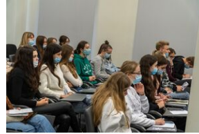
Uczestnicy konferencji edukacyjnej o stratach polskich dóbr kultury w czasie II wojny światowej „Dzieła utracone. Przywracanie pamięci”