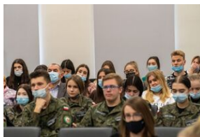
Młodzież z XXVII LO w Lublinie.