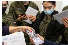
Młodzież z XXVII LO w Lublinie z pakietami mobilnej gry terenowej „Na ratunek Matejce”.