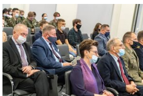
Uczestnicy konferencji edukacyjnej o stratach polskich dóbr kultury w czasie II wojny światowej „Dzieła utracone. Przywracanie pamięci”