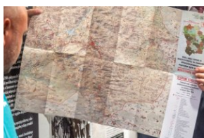
Przewodnik turystyczny: „Szlakami walk oddziałów antykomunistycznego podziemia na Zamojszczyźnie w latach 1944-1956”.

W okresie od 1944 do 1947 roku, na terenie kilku powiatów tego regionu, działało wiele oddziałów partyzanckich, podporządkowanych Obwodowi i Inspektoratowi Zamojskiemu AK-DSZ-WiN, a po amnestii w 1947 roku nadal walczyły grupy wchodzące wówczas w skład II Inspektoratu Zamojskiego AK oraz Samodzielnego Obwodu WiN Tomaszów Lubelski. Z naszym przewodnikiem w ręku poznacie nie tylko historię bohaterskich akcji Żołnierzy Wyklętych, ale zaprowadzi on Was również w miejsca oddalone od głównych szlaków komunikacyjnych, często nieznane bądź zapomniane, ale zawsze związane z walką lub męczeństwem żołnierzy niepodległościowego podziemia. Zapraszamy do poznania losów ludzi, którzy z bronią w ręku zmagali się z komunistami na Zamojszczyźnie do połowy lat 50. XX wieku.