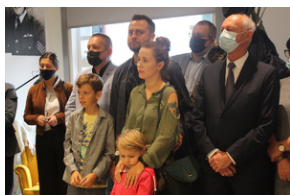
Otwarcie księgarni IPN - Lublin, 24 września 2021.