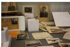
Otwarcie księgarni IPN - Lublin, 24 września 2021.