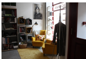
Otwarcie księgarni IPN - Lublin, 24 września 2021.