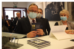
Otwarcie księgarni IPN - Lublin, 24 września 2021.