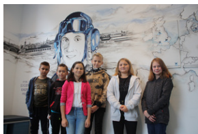
Otwarcie księgarni IPN - Lublin, 24 września 2021.