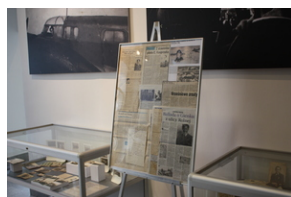
Otwarcie księgarni IPN - Lublin, 24 września 2021.