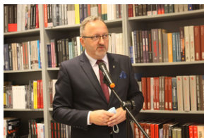
Otwarcie księgarni IPN - Lublin, 24 września 2021.