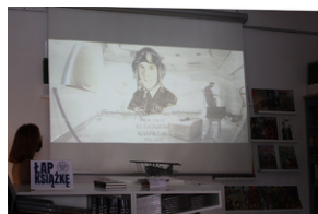
Otwarcie księgarni IPN - Lublin, 24 września 2021.