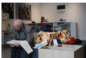
Otwarcie księgarni IPN - Lublin, 24 września 2021.