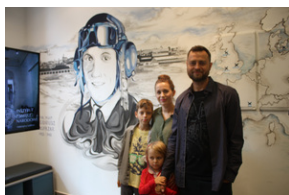
Otwarcie księgarni IPN - Lublin, 24 września 2021.