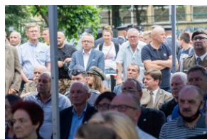
Uczestnicy oficjalnych obchodów upamiętniających Radomski Czerwiec '76.