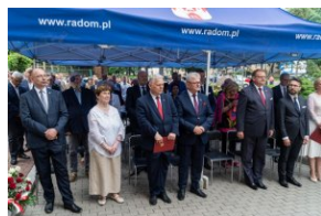
Uczestnicy oficjalnych obchodów upamiętniających Radomski Czerwiec '76.