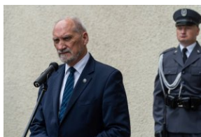
Antoni Macierewicz (Poseł na Sejm RP).