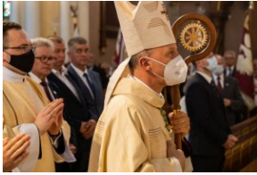
Uroczystości upamiętniające Radomski Czerwiec '76. Nabożeństwo w katedrze radomskiej.