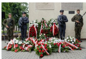
Kwiaty złożone pod tablicą upamiętniającą Radomski Czerwiec '76.