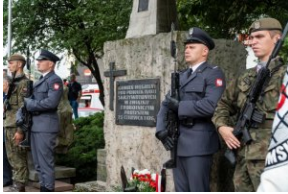
Pomnik Czerwca 1976 r. w Radomiu.

Później uroczystości przeniosły się na skrzyżowanie ul. 25 Czerwca 76 i Żeromskiego, gdzie znajduje się pomnik Czerwca 1976 roku. Tam złożono kwiaty i zapalono znicze. Ostatnim punktem programu oficjalnych obchodów upamiętniających protesty było nabożeństwo w katedrze radomskiej.