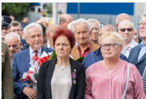
Uczestnicy oficjalnych obchodów upamiętniających Radomski Czerwiec '76.