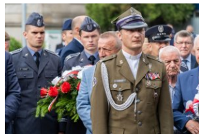
Uczestnicy oficjalnych obchodów upamiętniających Radomski Czerwiec '76.