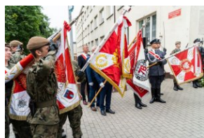
Poczty sztandarowe podczas uroczystości upamiętniających Radomski Czerwiec '76.