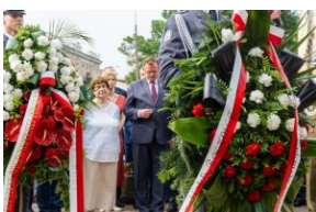
Kwiaty składane pod pomnikiem Czerwca 1976 r. w Radomiu.