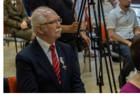
Uczestnicy uroczystości wręczenia Krzyży Wolności i Solidarności działaczom opozycji demokratycznej.