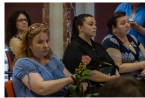
Uczestnicy uroczystości wręczenia Krzyży Wolności i Solidarności działaczom opozycji demokratycznej.