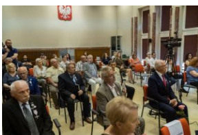
Uczestnicy uroczystości wręczenia Krzyży Wolności i Solidarności działaczom opozycji demokratycznej.

Zastępca prezesa IPN zwrócił także uwagę na to, że uczestnicy protestów radomskich w czerwcu 1976 r. cztery lata później stanęli w szeregach „Solidarności”. Sam Radomski Czerwiec '76 stał się także pewną cezurą, od której zaczynane są książki historyczne o opozycji demokratycznej z czasów PRL, np. wydawnictwo IPN Encyklopedia Solidarności .