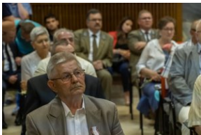
Uczestnicy uroczystości wręczenia Krzyży Wolności i Solidarności działaczom opozycji demokratycznej.