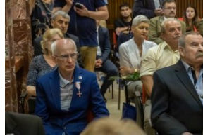
Uczestnicy uroczystości wręczenia Krzyży Wolności i Solidarności działaczom opozycji demokratycznej.