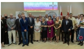
Wspólne zdjęcie odznaczonych Krzyżem Wolności i Solidarności działaczom opozycji demokratycznej i honorowych gości.

- Dziękuję za pamięć o tych, którzy walczyli z systemem komunistycznym o wolność, godność i solidarność – mówił bratanek prześladowanego przez komunistyczny reżim ks. Romana Kotlarza.