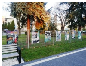
Wystawa „Stan wojenny 1981-1983” w Tomaszowie Lubelskim.

Wystawa „Stan wojenny 1981-1983” od 5 grudnia jest eksponowana na placu przy Starostwie Powiatowym w Tomaszowie Lubelskim (ul. Lwowska 68), natomiast od 7 grudnia, przy Urzędzie Gminy w Telatynie (ul. F. Chopina 10), prezentowana jest wystawa „Bunt robotników. Grudzień '70 - luty '71”.