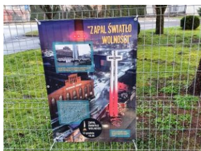
Wystawa „Stan wojenny 1981-1983” w Tomaszowie Lubelskim.