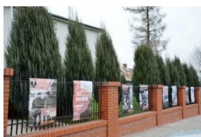
Wystawa „Bunt robotników. Grudzień '70 - luty '71” w Tomaszowie Lubelskim.