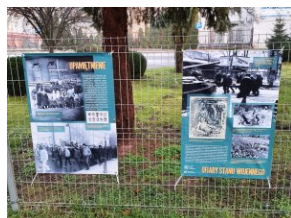
Wystawa „Stan wojenny 1981-1983” w Tomaszowie Lubelskim.