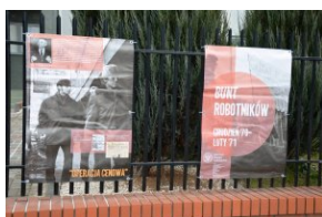
Wystawa „Bunt robotników. Grudzień '70 - luty '71” w Tomaszowie Lubelskim.

Wystawa „Stan wojenny 1981-1983” od 5 grudnia jest eksponowana na placu przy Starostwie Powiatowym w Tomaszowie Lubelskim (ul. Lwowska 68), natomiast od 7 grudnia, przy Urzędzie Gminy w Telatynie (ul. F. Chopina 10), prezentowana jest wystawa „Bunt robotników. Grudzień '70 - luty '71”.