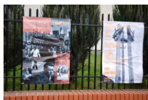
Wystawa „Bunt robotników. Grudzień '70 - luty '71” w Tomaszowie Lubelskim.