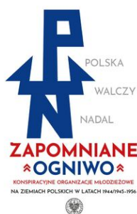
Wystawa autorstwa Jacka Wołoszyna „Zapomniane ogniwo. Konspiracyjne organizacje młodzieżowe na ziemiach polskich w latach 1944/45–1956”