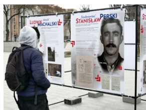
Wystawa autorstwa Jacka Wołoszyna „Zapomniane ogniwo. Konspiracyjne organizacje młodzieżowe na ziemiach polskich w latach 1944/45–1956”.