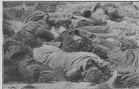
Wzięci do niewoli, rozstrzani i wyrzuceni samolotami we wsi Lemoniaż zicami lotniskowej pow. kolnieszkiej: 1 oficer 69 p. p., 37 żołnierzy i 5 cywilnych z II-go batalionu Kowieńskiego p. p. dnia 25-go lipca 1920 roku. Pochowani zostali przez ludność m. Kolna.

Odradzająca się w ogniu wojen lat 1918-1921 Rzeczpospolita Polska nie była stroną konwencji haskiej z 1907 r., regulującej kwestie jeńców wojennych, jednak uznawała jej postanowienia. Odnosiło się to także do wojny polsko-bolszewickiej, która rozpoczęła się de facto 4 stycznia 1919 r. w okolicach Wilna, a zakończyła de iure traktatem pokojowym zawartym 18 marca 1921 r. w Rydze. Kończąc wojnę, obie strony w układzie o repatriacji z 24 lutego 1921 r. uznały, że status jeńców mają też wszystkie osoby, które służyły w polskich formacjach zbrojnych walczących z bolszewikami na terenie Rosji w latach 1917-1920.